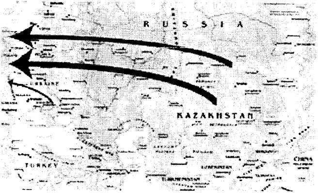
Zuwanderung aus der GUS in die Bundesrepublik Deutschland

einem unterschiedlichen Status, mit unterschiedlichen Ansprüchen auf Eingliederungsleistungen und unterschiedlicher Aufenthaltssicherheit leben. Die Nichtzuerkennung des Spätaussiedlerstatus, die zugleich die Aberkennung von Hilfsansprüchen oder sogar des sicheren Aufenthaltsstatus bedeutet, betrifft